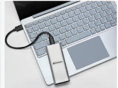
PCのメモリーとして