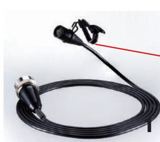
ラベリアマイクロホン UM80C

悪天候での中継から番組制作で特に水の多い現場で活躍します 水や汗・汚れに強い完全防水機能を備えており、ウォータースライダーや 温泉中継、釣り番組などの制作の際に安心してご使用いただけます