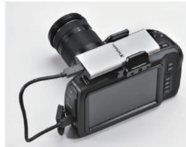
カメラのメディアとして