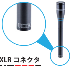
XLR コネクタ UM230C