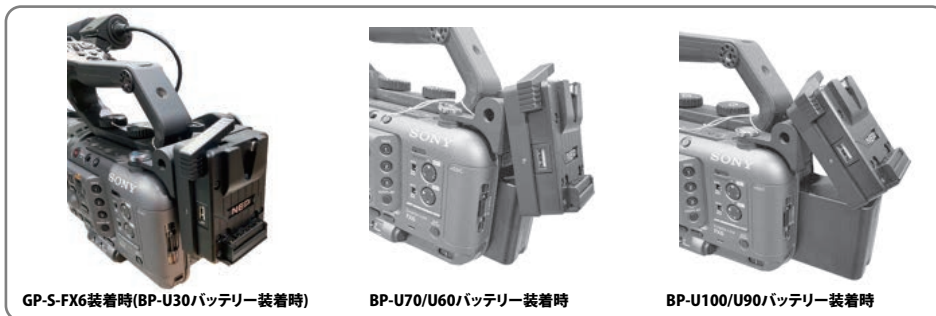
GP-S-FX6装着時(BP-U30バッテリー装着時)