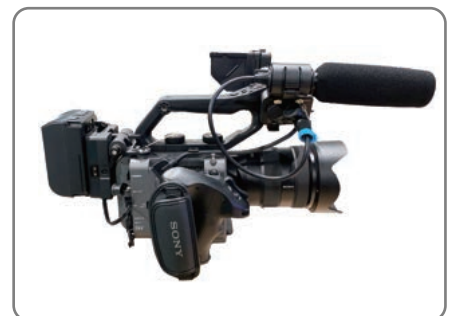
BP-U100/U90バッテリー装着時